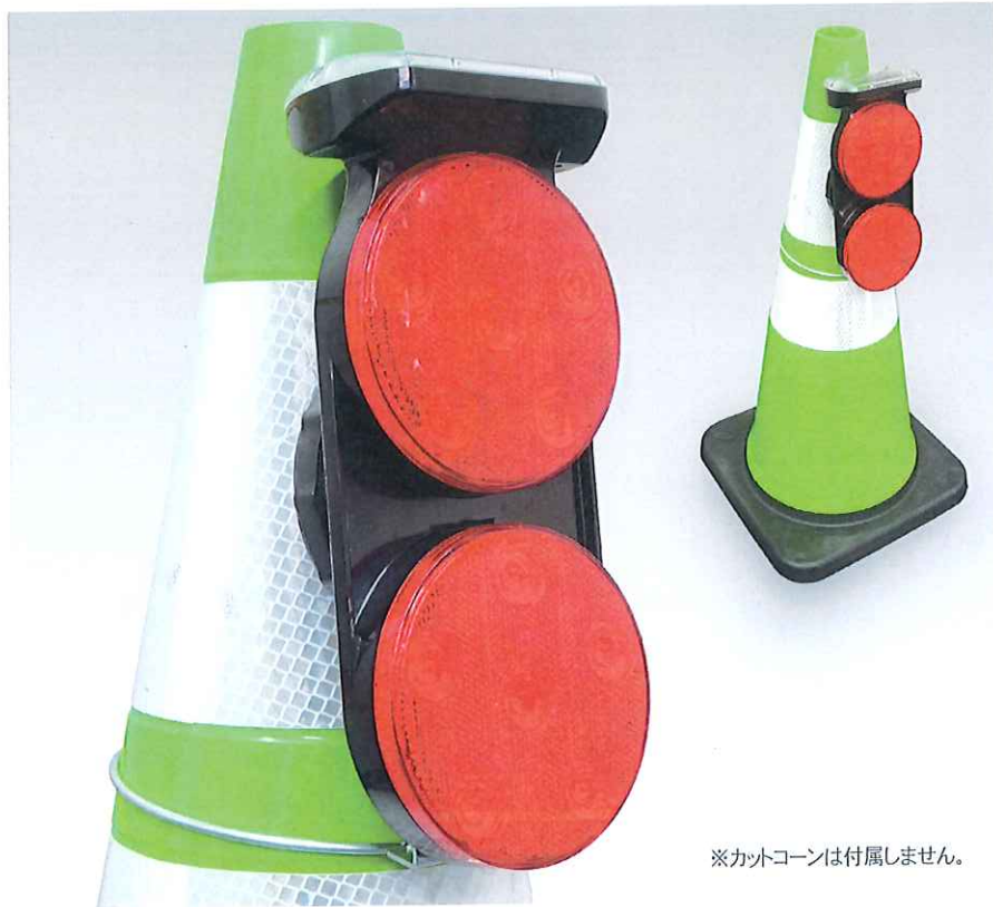
※カットコーンは付属しません。