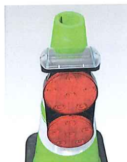
リングを通すだけの簡単設置です。

●電源はソーラーと乾電池の2電源。 ソーラー側が充電不足になると乾電池に切り替わるハイブリッド仕様です。充電され十分な容量になると、再度ソーラー側に切り替わります。