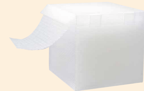
プチボードケース付き

つづら状に折った梱包形態のスパスパです。 ケース入りなので、ホコリの侵入を防止できます。 専用ケース入りタイプと、詰替え用簡易包装タイプがあります。