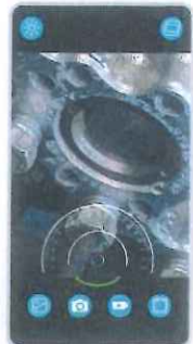
アプリ画面イメージ