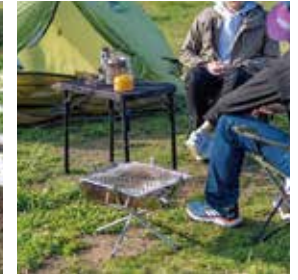
キャンプ・アウトドア